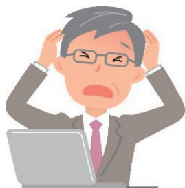
名ばかりの管理職

期待する社員に「管理職」というポストを与えたら、すべて上手く行くことはそうそうありません。